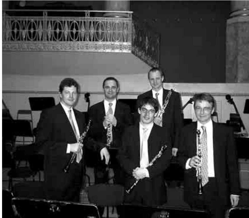
Oboengruppe der Wiener Symphoniker

In den folgenden Ausgaben stellen wir jeweils eine Oboengruppe vor. Anschließend an das Orchesterjubiläum, über das wir in den letzten Ausgaben berichtet haben, beginnen wir mit den Wiener Symphonikern.