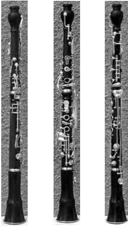
Oboe von Hubert Schüick